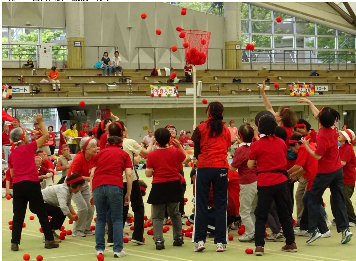
第24回同大会 競技の様子

運営 第25回ふれあいスポーツ大会実行委員会 北九州市立年長者研修大学校穴生学舎